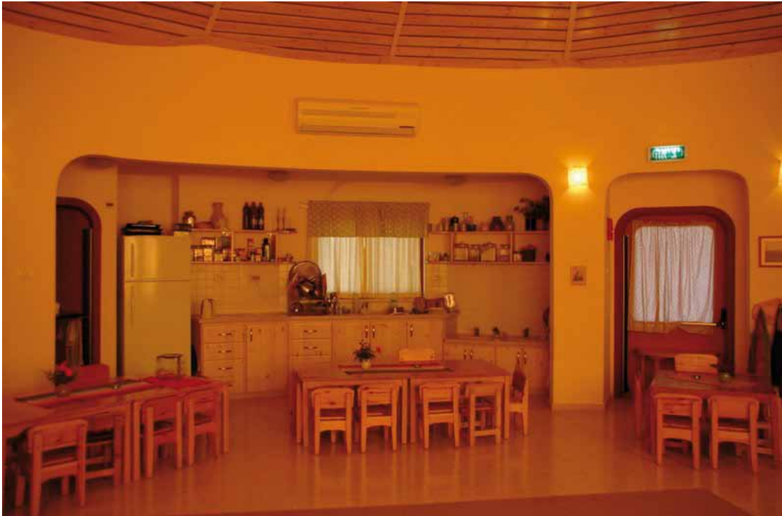
מבט למטבח ופינת האוכל

כל מה שנאמר עד כה קשור יותר לחלל הפנימי של הגן. חשוב לאפיין את השוני בתפיסה בין פנים לחוץ לגבי כל מבנה כדי לנסות להסביר מה הוביל לגיבוש צורתו החיצונית של הגן. חלל פנימי של בית הוא מעין "מיקרוקוסמוס" – עולם קטן בפני עצמו. כאשר נכנסים לבית וסוגרים את הדלת, החלל הפנימי של הבית עוטף ומקיף אותנו ועברנו הוא העולם. הפרופורציות, הצורות, החומרים, הצבעים, הרהיטים וכדומה משפיעים עלינו באופן ישיר, כשם שהשמש, כיפת השמים, מזג האוויר, צורות הנוף והצמחים משפיעים עלינו כאשר אנחנו בחיק הטבע.