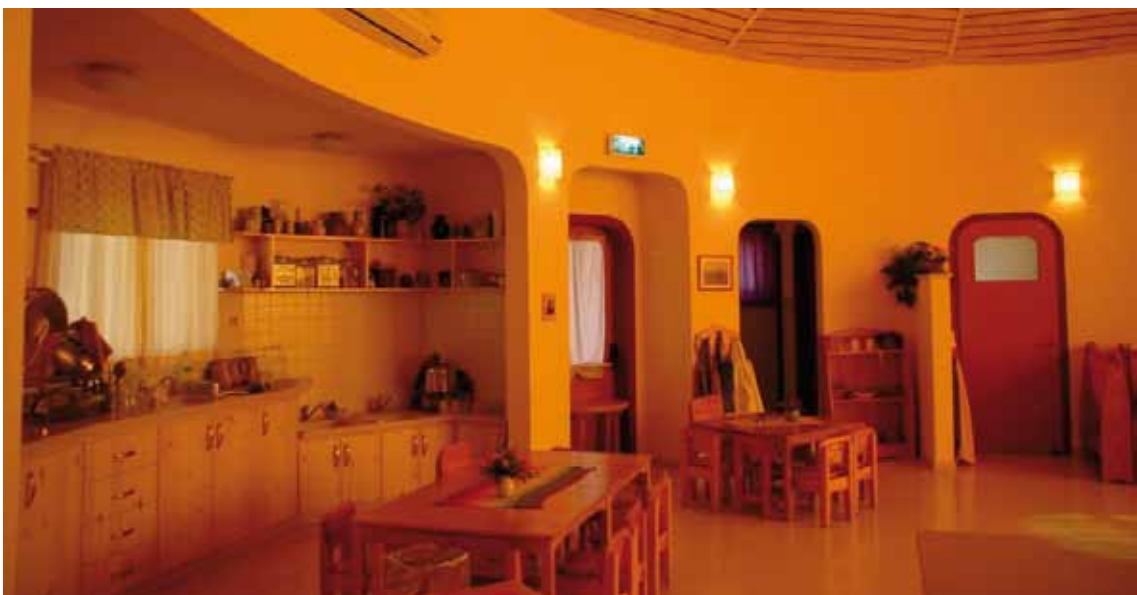
פתחים ודלתות בחלל המרכזי

לצורות הפתחים – דלתות, חלונות ומעברים – יש משמעות רבה בחוויה הנפשית של הילדים, עליהם "לדבר" עם צורת התקרה ועם החלל האמצעי המעוגל, ולכן גם הם קשתיים ומעוגלים. המאמץ האדריכלי מתמקד ביצירת מבנה שכל מרכיביו "מדברים" בשפה אחת והם חלק מאורגניזם שלם, דבר שהוא בעל חשיבות רבה בתמיכה בחוויה השלמותית של הילד.