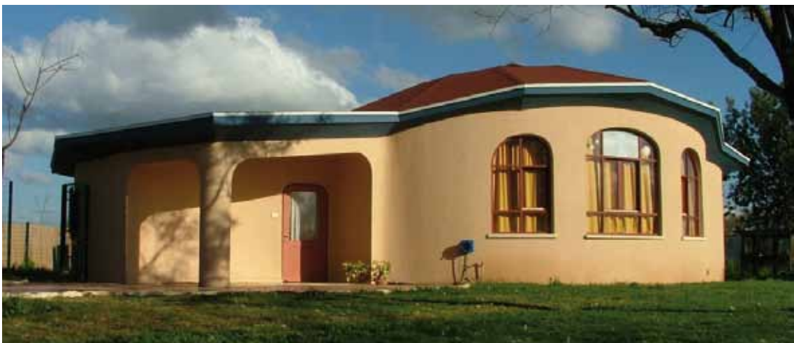
מבט לחזית קדמית ומרפסת הכניסה

הצורה החיצונית של הבית פועלת עלינו אחרת, היא אובייקט מחוץ לנו, שאנחנו תופסים בדימוי כתמונה פנימית, תמונה שמשפיעה באופן עדין יותר ושונה על החיים הפנימיים שלנו. נשאלת השאלה, מה אנו רוצים שיתגלה למי שמתעמק בתמונה זו, מה תספר צורתו החיצונית של גן הילדים עליו וגם עלינו, מי שיזם והקים אותו? כיצד היא תשפיע על המתבונן?