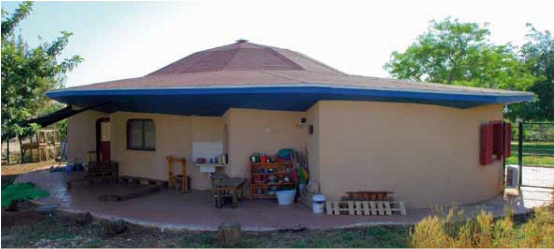
חזית הפונה לחצר הגן

התמונה הפנימית שאנו מבקשים ליצור לאור כל זאת היא זיכרון של שלמות "גן עדנית", חיים, תנועה ומרכז פנימי שמחבר והופך את המבנה לישות אחת. אנו מקווים שגן הילדים בהרדוף אכן משקף לקורא משהו ממה ששאפנו אליו ובטוחים שניתן יהיה בעתיד לעשות זאת טוב יותר. נמשיך לשאוף לכך.