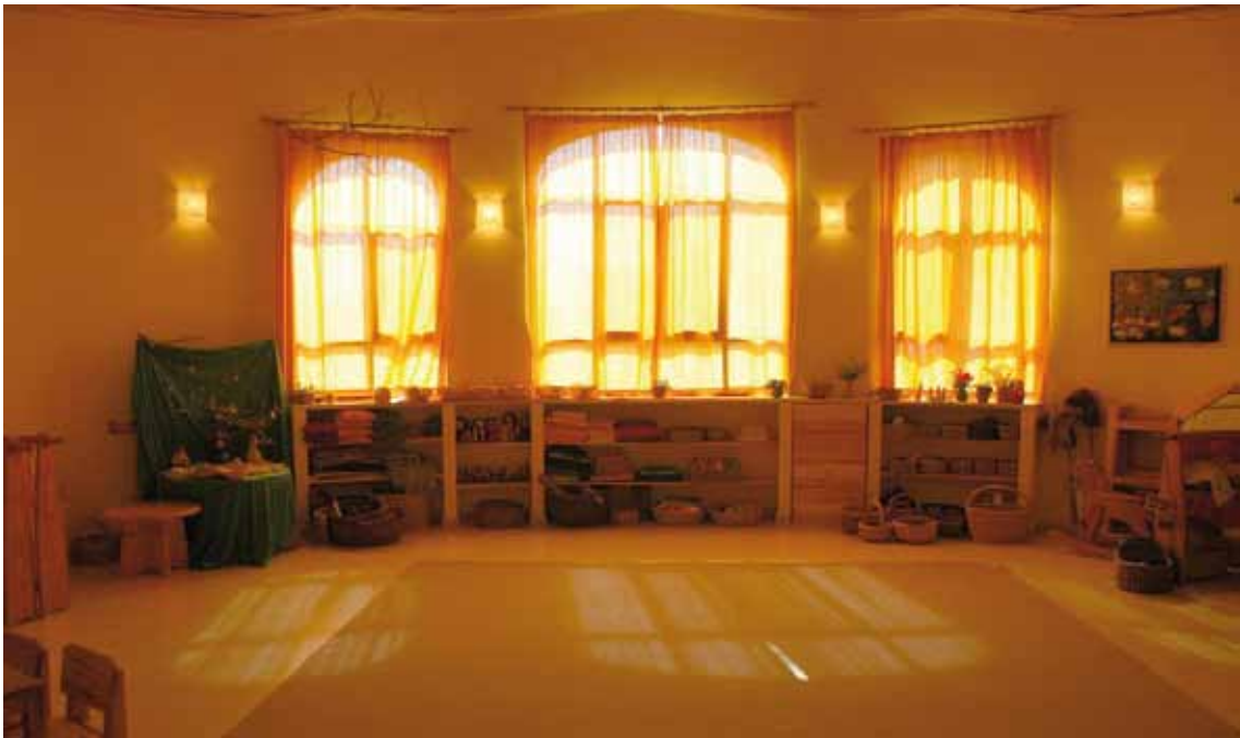
החלל המרכזי של הגן, מדפי המשחקים

צורך חינוכי נוסף שעולה מגיל זה הוא יצירת סביבה "חמה". החום פותח, שומר על התום והרכות ומאפשר, כחממה, לכוחות הילדות לבוא לידי ביטוי. הקור, לעומתו, מקשה, מפריד ומזרז את תהליך ההתבגרות. תחושה של חום בחלל יכולה להיווצר הן באמצעות חומרים כגון שימוש מרובה בעץ, צבעים חמים, וילונות וכדומה והן באמצעות הצורות המעוגלות, בעלות הקווים הרכים. אם נרצה דווקא איכויות של קור, דבר שמתאים לגיל מבוגר בהרבה, ניצור במודע מבנה שמבוסס על זוויות חדות וקווים ישרים. הריהוט, פרטי הגימור, בחירת החומרים והתאמתם זה לזה חשוב שיעשו מתוך גישה אמנותית וירידה לפרטים. המגע האנושי (כמה שיותר עבודת יד) ותהליכי היצירה שעומדים מאחורי אמנותית, לתשומת הלב, למגע אנושי ולירידה לפרטים אין תחליף תעשייתי או מכני. כל הפץ שנמצא בגן חשובים. כל מפגש של הילד עם המרכיבים של הגן מסייע בעיצובו ומשפיע עליו.