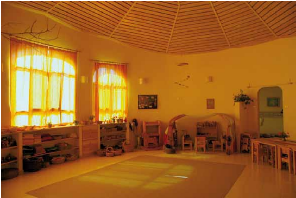
החלל המרכזי של הגן