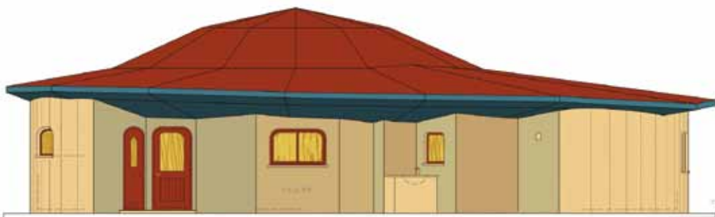
חזית הפונה לחצר הגן

האספקט השלישי שאליו התייחסנו הוא השאיפה שגן הילדים ישקף ויבטא בצורתו את רוח הזמן, שמבחינה צורנית יהיה רלוונטי לתודעה ולאידאלים הרוחניים של אדם בן זמננו. כאן מדובר על אספקט של המבנה שפונה לכל אדם, מכיוון שהצורה החיצונית של המבנה רלוונטית ומשפיעה על כל אדם שנמצא בסביבתו. אספקט זה בא לידי ביטוי בסגנון אדריכלי ששואף לעבור מצורות מופשטות וסטטיות לצורות דינמיות ואורגניות בעלות מרכז פנימי.